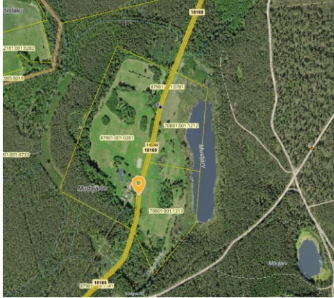
Joonis 1. Ristumiskoha orienteeruv asukoht riigitee 18169 Partsi-Timo tee km 4,24 - 4,28

Võttes aluseks ehitusseadustiku (edaspidi EhS) § 99 lg 3, määrab Transpordiamet järgmised nõuded ristumiskoha ühendamiseks riigiteega nr 18169 Partsi-Timo tee km 4,24-4,28 lõigul (joonis 1). Ristumiskoht rajatakse juurdepääsuks Järvemetsa katastriüksusele (tunnus 70801:001:1213 , sihtotstarve maatulundusmaa 100%), mis asub Põlva maakonnas, Räpina vallas , Timo külas.